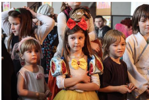
Maškarní bál pro děti