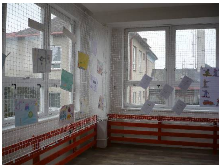
učebna pohybových aktivit