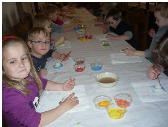
Velikonoce na hradě Šternberk