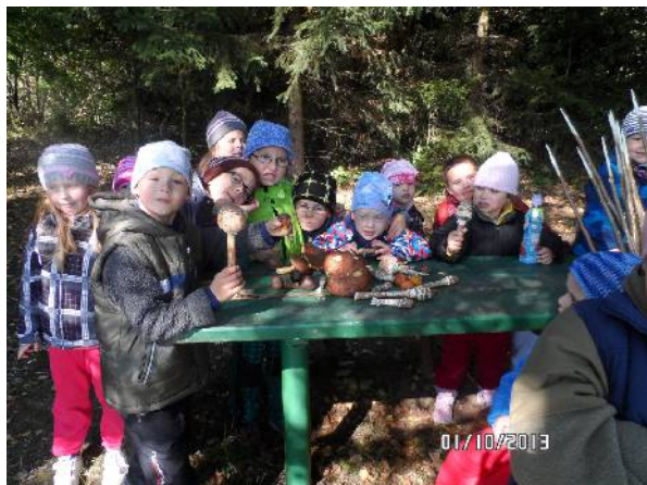
Výlet do Slavoňova

Severomoravské divadlo Šumperk – 2 divadelní představení pro malé i velké Maňáskové divadlo ve školce Cirkus Pavlini ve škole – vystoupení pro všechny Filmové představení v kině Retro v Zábřehu pro MŠ Výchovný koncert ZUŠ Zábřeh – Vánoční koncert a vystoupení na konci školního roku Mikulášská nadílka Zpívání u stromečku Vánoční výstava na ZŠ Školská Zábřeh Vánoční dílna v DDM Zábřeh - ZŠ Velikonoce na hradě Šternberk – MŠ Keramika v DDM Zábřeh – I. třída Návštěva Knihovny v Zábřehu i Lukavici – MŠ a ZŠ interaktivní výstava Ptáci a savci - Vlastivědné muzeum Zábřeh - ZŠ interaktivní výstava Putování středověkem – Vlastivědné muzeum Zábřeh – ZŠ interaktivní výstava Život s handicapem – Vlastivědné muzeum Šumperk - ZŠ program Den chleba – Vlastivědné muzeum Mohelnice – MŠ vlastivědný program Domovní znamení – Muzeum Olomouc - ZŠ Skanzen Příkazy - školní výlet MŠ Od renesance k baroku aneb putování Moravskou Třebovou – školní výlet ZŠ Výlet do Slavoňova – společná akce MŠ a I. třídy Dopravní hřiště Mohelnice – 2krát ročně pro žáky ZŠ V rámci prevence vyšetření zraku dětí z MŠ