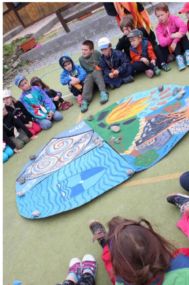
Živly - Hraběšice

Divadelní představení v KD Zábřeh – 4 návštěvy ZŠ a MŠ