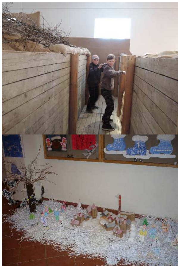
Šumpersko za Velké války 1914 – 1918