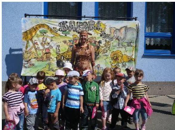
Karneval s Míšou