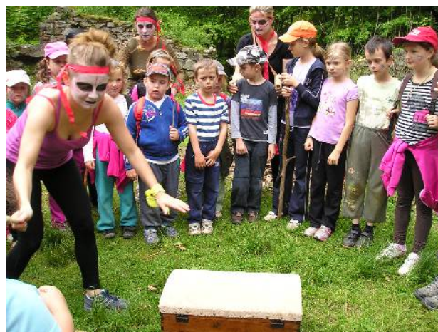
Trosečníci – Račí údolí u Javorníka