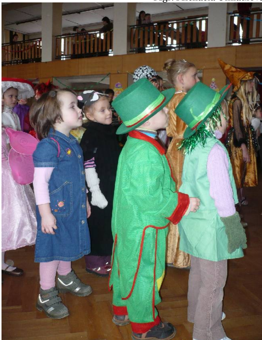
Maškarní karneval v Lukavici.....chvíle napětí, co se bude dít.