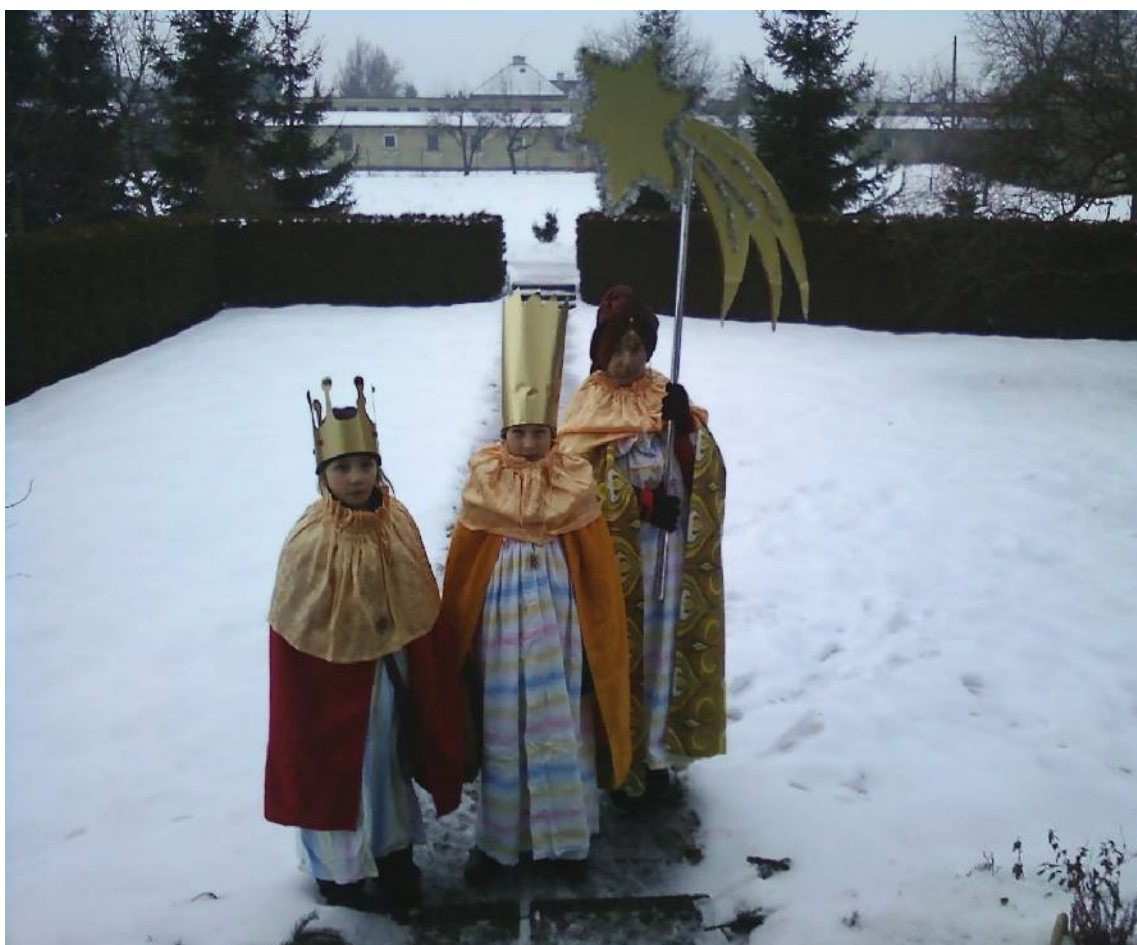
Skupinka Tří králů v Lukavici

Vydává Obec Lukavice Ročník 2011/1 BŘEZEN e-mail:ou.lukavice@seznam.cz www.lukavice.zabrezsko.cz