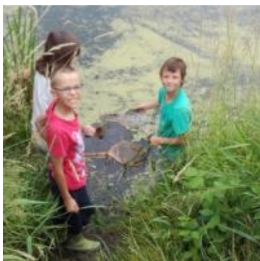
Jak to chodí v rybníce