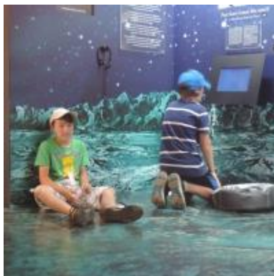
Praha – Muzeum K. Zemana