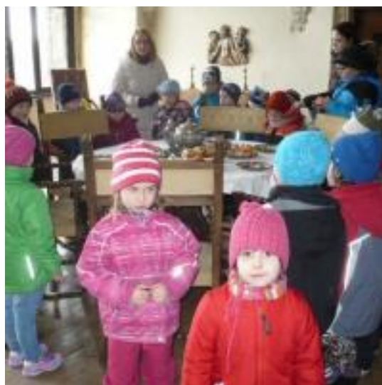
Velikonoce na hradě Šternberk