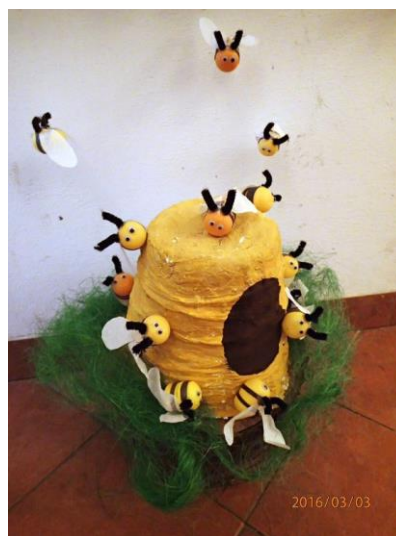
Březen, za kamna vlezem