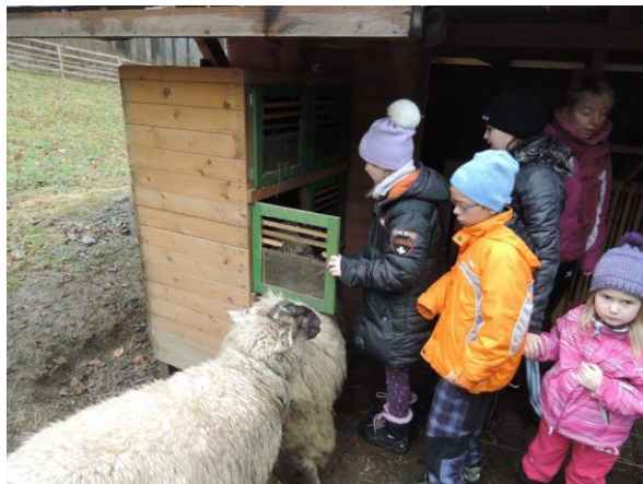
Švagrov – ozdravný pobyt