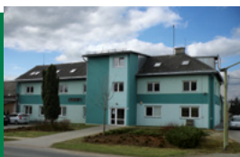
Místo výkonu práce: Svěbohov

Chcete pracovat v české rodinné firmě světového významu, která prodává stroje vlastní výroby od A do Z do celého světa? Možná hledáme právě vás!