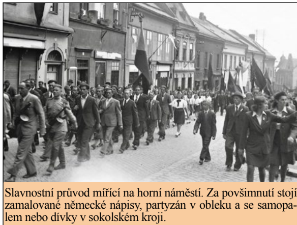
Slavnostní průvod mířící na horní náměstí. Za povšimnutí stojí zamalované německé nápisy, partyzán v obleku a se samopalem nebo dívky v sokolském kroji.