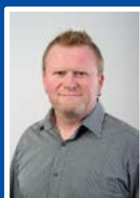
Petr Čech OSVČ